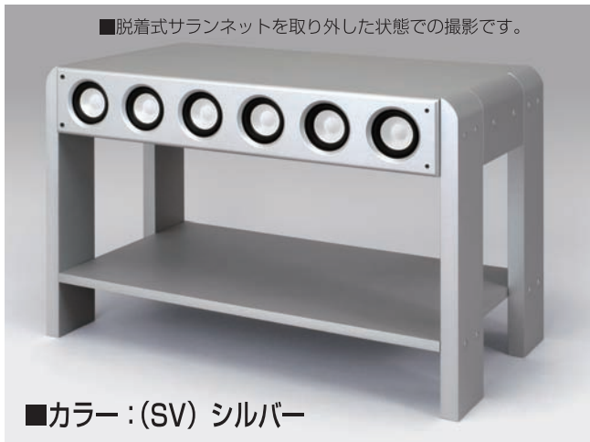
■脱着式サラネットを取り外した状態での撮影です。