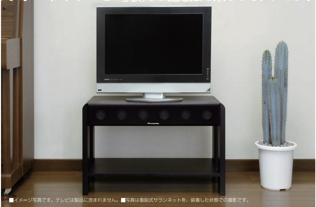
■イメージ写真です。テレビは製品に含まれません。■写真は着脱式サラネットを、装着した状態での撮影です。