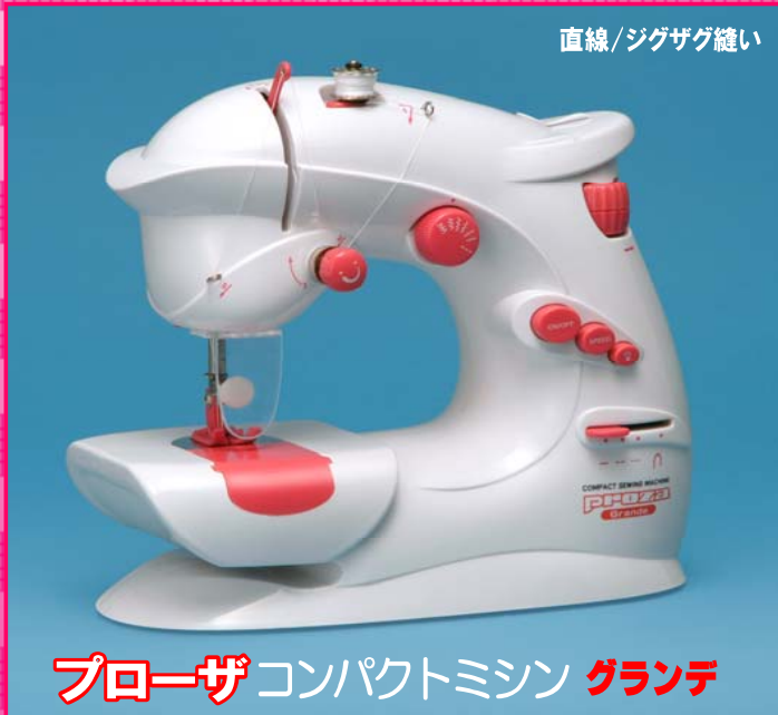
プローザコンパクトミシン グランデ